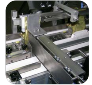
0.2 Dispositivo PN in ingresso