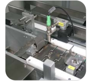
0.1 Nastro a spintori