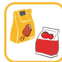
Film per l'imballaggio a caldo e surgelati