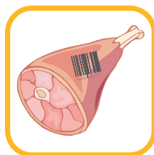
Contatto alimentare diretto