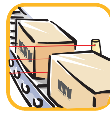
Smistamento e trasporto